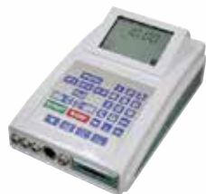
Das portable Bioresonanzgerät Rayocomp PS 10.

Für die Testung und für die Harmonisierung werden Frequenzspektren benötigt. Diese werden von Bioresonanzgeräten erzeugt, die in verschiedenen Ausführungen erhältlich sind.