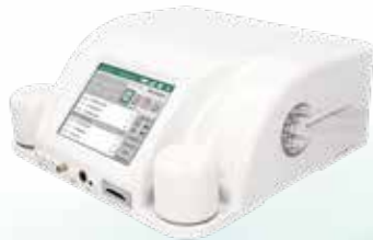
Das High med Bioresonanzgerät Rayocomp PS 1000 polar 4.0.

Wichtiger Hinweis: Bitte beachten Sie, dass die hier gegebenen Hinweise, Ratschläge und Lösungsansätze aus einer über 35-jährigen Erfahrung stammen, aber dennoch nicht den Gang zum Heilpraktiker oder naturheilkundlich orientierten Arzt ersetzen können. Weiterhin wird darauf hingewiesen, dass die klassische Schulmedizin die Wirkung bioenergetischer Schwingungen weder akzeptiert noch anerkannt hat.