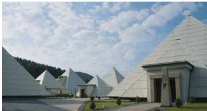
Der Sitz der Rayonex Biomedical GmbH, die Sauerland-Pyramiden in Lennestadt-Meggen.